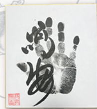
●力士直筆サイン例

お楽しみコーナー&抽選会も実施 開場直後からの力士四名による握手会のあと、力士に直接質問して大相撲の知識を深めていただける質問コーナーや、ご来場の皆様から抽選で20名様に、力士直筆サインや相撲土産が当たる、お楽しみ抽選会も行います。巡業ならではの楽しい企画が盛りだくさんです。